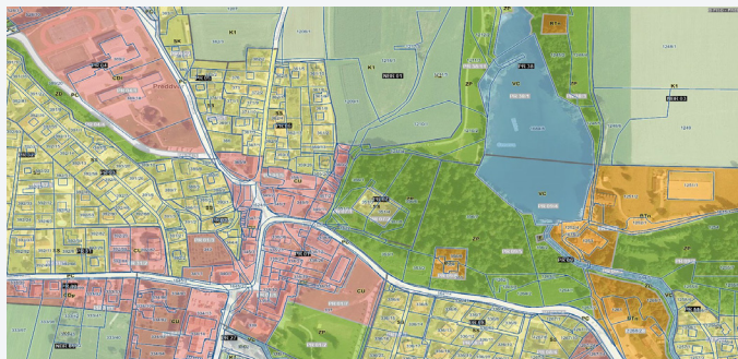
prikaz sprememb ob tehnični posodobitvi OPN

Izvedba od tehničnega dela z razvitimi algoritmi do formalizacije postopka po 142. členu ZUreP-3.